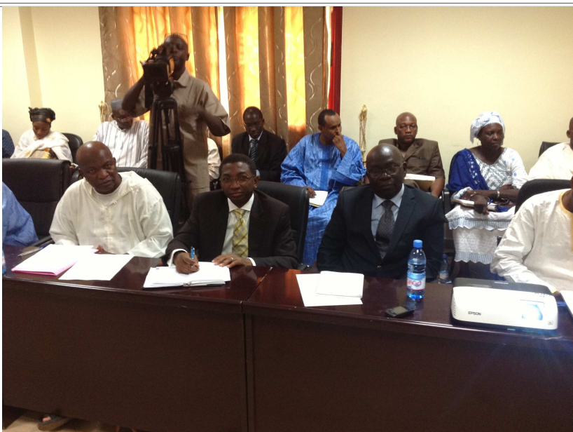
Une vue des consultants

A la clôture de la session, il a été convenu que les deux ministères concernés donneront leurs commentaires afin de suivre une feuille de route de 4 mois pour l'élaboration de la politique de financement de la santé.